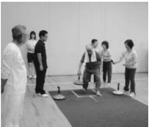
※地域スポーツ振興事業に関するお問い合わせはスポーツ係へ TEL 045(364)0025